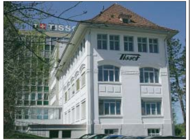
Comme sa voisine, la ville du Locle a été largement façonnée par le développement de l'horlogerie.