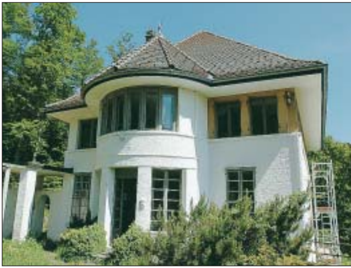
La Maison blanche est l'un des bâtiments de Le Corbusier candidat à l'inscription au patrimoine mondial de l'Unesco.