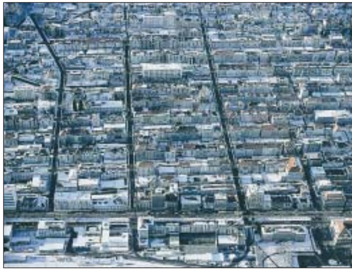
La ville en damier est considérée comme exemplaire de l'histoire industrielle des Montagnes neuchâtelaises.