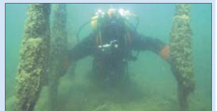
Le patrimoine préhistorique sous-lacustre est une des richesses des lacs de Neuchâtel, Morat et Bienna.

Autre candidat retenu, le vignoble vaudois de Lavaux. Da-