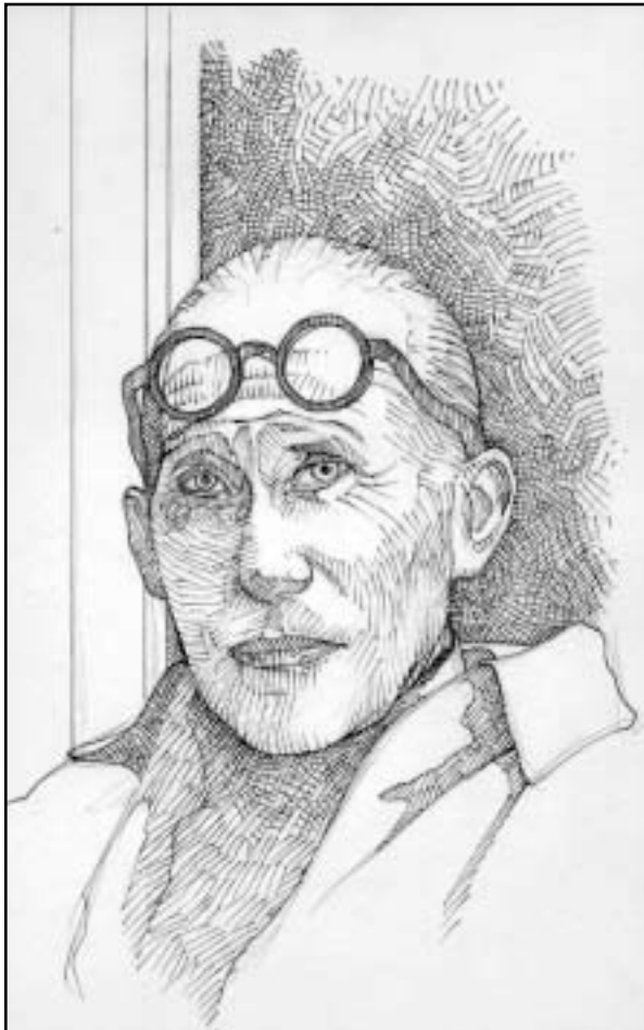
L'œuvre architecturale chaux-de-fonnière de Le Corbusier fait partie du patrimoine à sauvegarder.