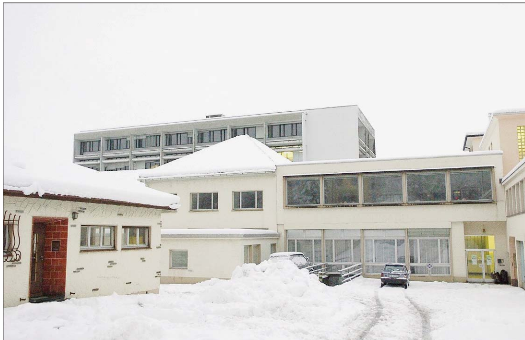
EX-FABRIQUE VOUMARD Dans des locaux dont il n'a jamais payé la location, le FX Groupe n'a pu démarrer aucune production. Faute de matériel, de produits et de contrats.

«L'attitude de l'entreprise est inqualifiable», a tonné l'un des deux mandataires des employés. «Il est indispensable que