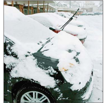
HIVER Trente-cinq voitures ont été évacuées dans la nuit de lundi à hier.

Malgré les informations diffusées lundi et les chutes de neige relativement abondantes durant l'après-midi, passablement de voitures ont été mal stationnées à La Chaux-de-Fonds durant la nuit de lundi à hier et le matin.