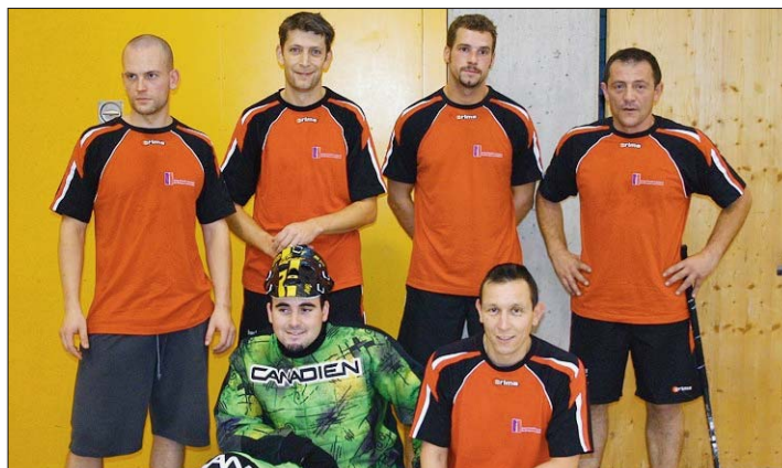
SIS DES MONTAGNES La deuxième équipe du SIS Montagnes a terminé cinquième, la première sixième. (SP)

Cette première ne sera donc pas la dernière, selon toute probabilité. A souligner que ces tournois corporatifs ont toujours lieu en semaine. Histoire de ne pas grignoter encore les rares week-ends que les sapeurs-pompiers peuvent passer en famille. /cl