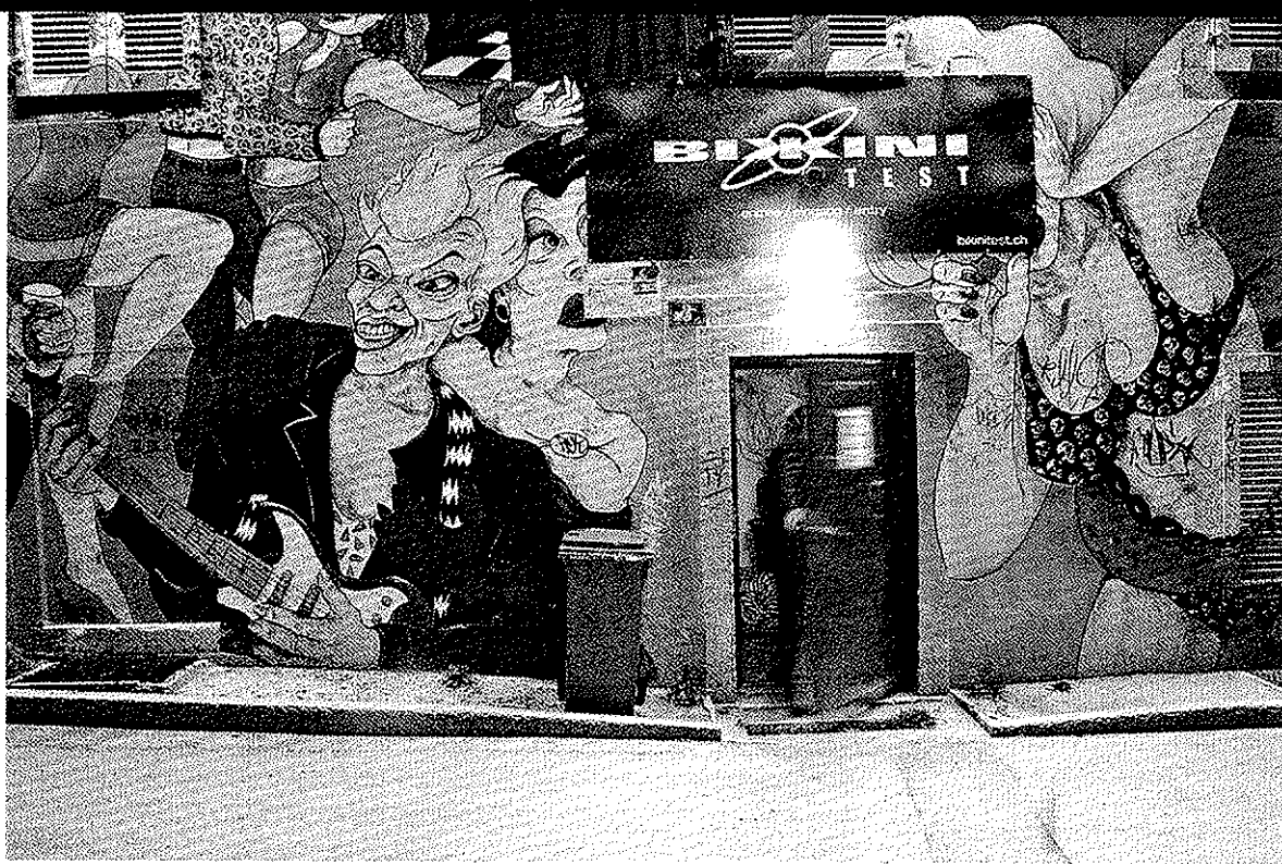
Graffiti. Poesie des Alltags.

Der «faux marbre», die Marmor-malerei, ist typisch für diese Zeit. Der Innenhof gehört zur heutigen Brasserie Ancien Manège. Das Haus war 1850 erst als Reitschule gebaut worden, 1880 entstanden hier dann Gemeinschaftswohnungen für die Zuzüger. In den letzten Jahrzehnten gammelte das Haus allerdings vor sich hin, bis ein Sponsor die Renovation finanzierte und das ganze Haus zu alter und vielleicht doch etwas verkitscht renovierter Pracht zurückführte. Im Erdgeschoss ist das Uhrenatelier Greubel Forsey eingemietet, das die komplexesten Tourbillons der Welt herstellt; Mechanismen,