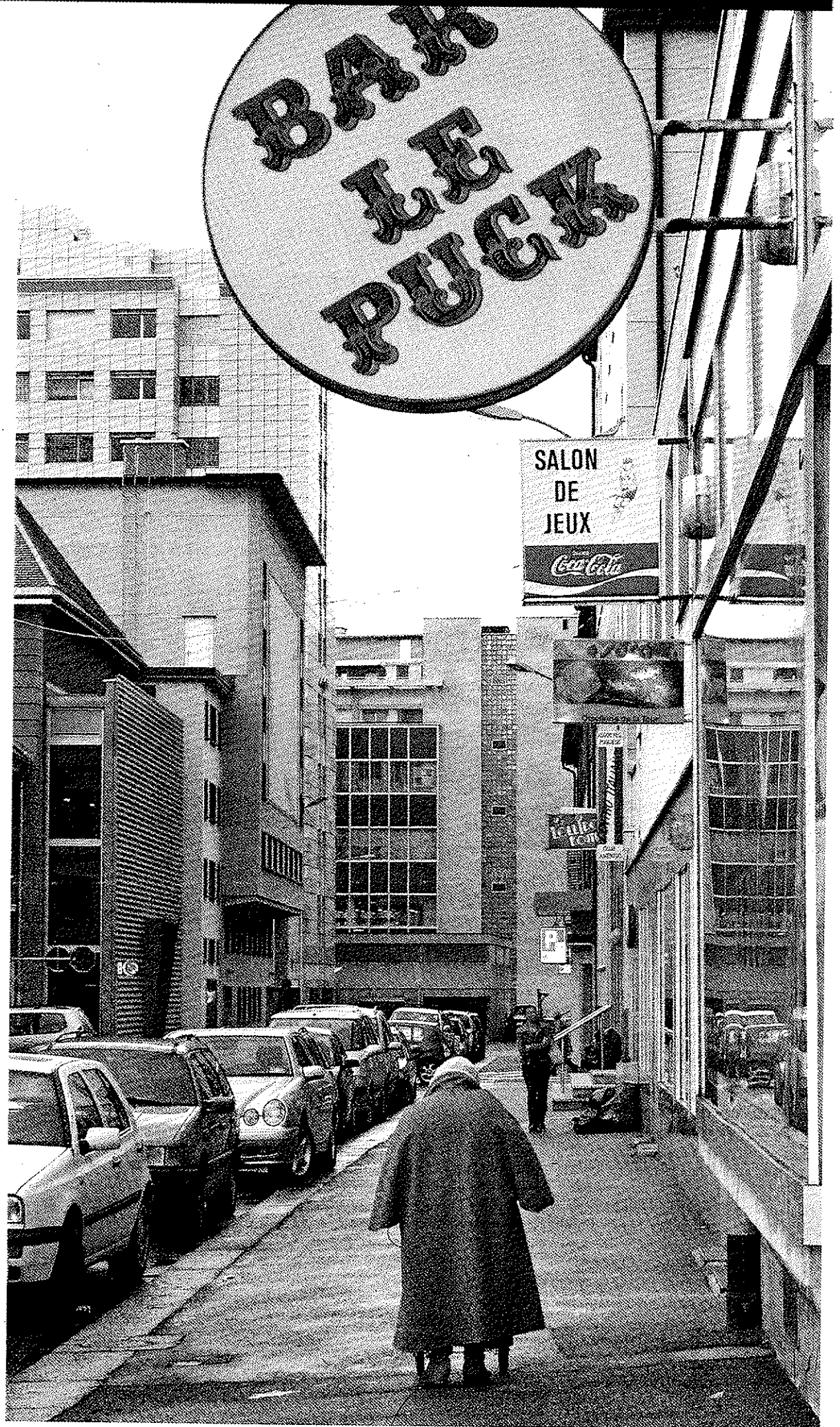
Leuchtreklamen. Bonjour Tristesse.

Allein in den 1890er-Jahren wuchs die Bevölkerung um einen Drittel. 1880 bis 1910 wurden nicht weniger als 1200 respektable Wohn- und Geschäftshäuser hochgezo- ▶