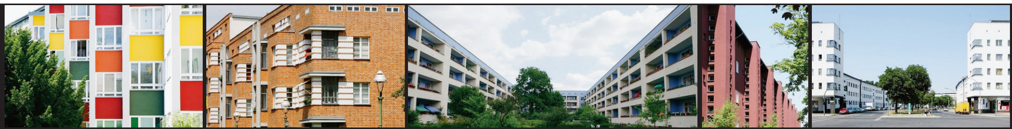
PATRIMOINE Le comité mondial a ajouté à la liste six lotissements sociaux de Berlin construits entre 1914 et 1933 pour répondre à un besoin. Des avant-gardistes comme Brunot Taut, Walter Gropius, Martin Wagner et Hans Scharoun ont inauguré un genre nouveau de l'habitat social qui a eu une influence majeure sur le développement de l'architecture et de l'urbanisme, a argumenté le comité.